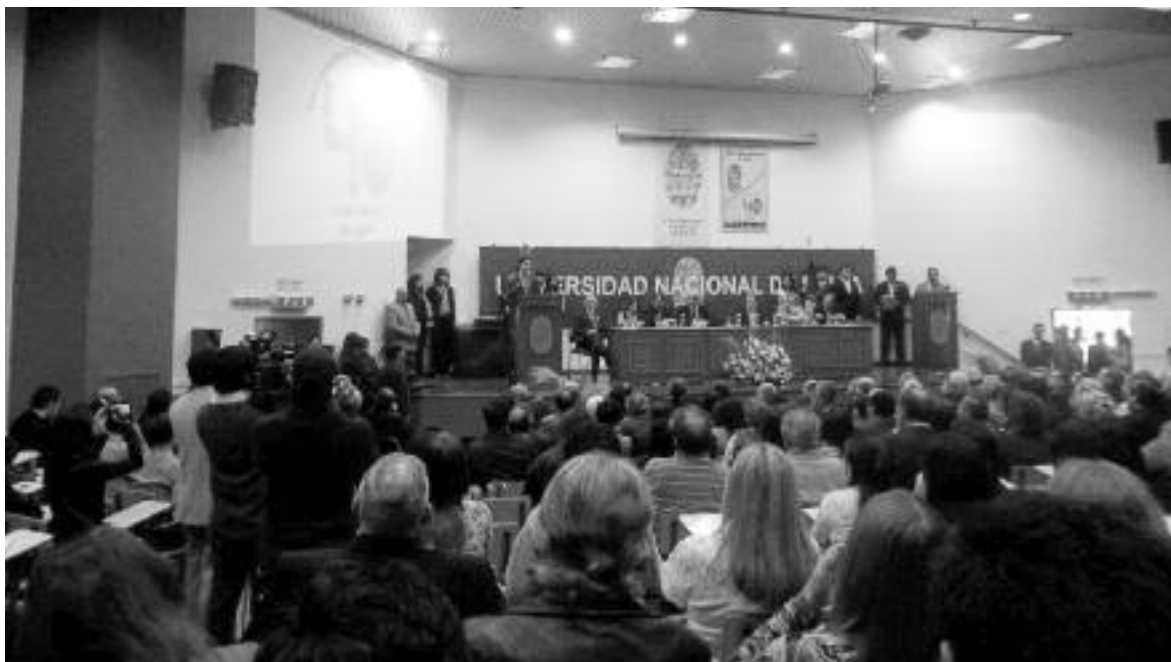
El gobernador de la provincia de Salta, doctor Juan Manuel Urtubey, haciendo uso de la palabra en el acto académico de la Universidad Nacional de Salta, el pasado 11 de mayo de 2012.

Aniversario que quedará en la memoria y servirá como motivación para seguir trabajando para otros tiempos. ¡Feliz Cumpleaños querida Universidad Nacional de Salta!