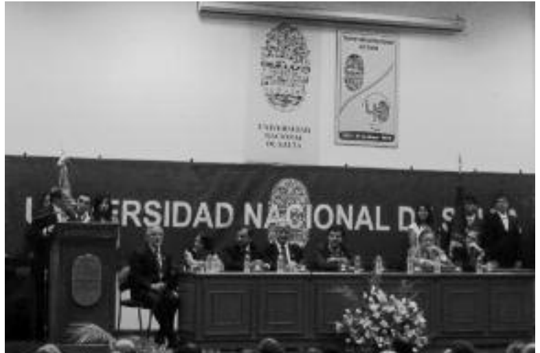
El Rector dirigiendo su mensaje en el acto académico realizado por los 40 años de la Universidad Nacional de Salta.